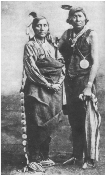
Abb. 5: Mexikanische Kickapoo um 1900.

begaben sich zunächst zu Gesprächen mit mexikanischen Beauftragten ins mexikanische Monterrey und zogen dann weiter nördlich nach Santa Rosa, wo sie sich mit den Kickapoo treffen wollten, dort aber von dem Angriff erfuhren. Sie schickten Mackenzie eine Mitteilung nach Ft. Clark, dass die Aktion ihrer Mission wahrscheinlich geholfen habe und gratulierten zum Erfolg. (Mackenzie drückte gegenüber Augur die Bereitschaft aus, bei Bedarf mit dem gesamten Regiment sowie texanischen Freiwilligen in Mexiko einzumarschieren, aber auf diese Provokation wurde klugerweise verzichtet.)