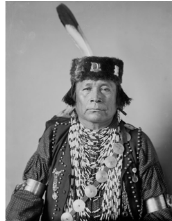
Abb. 6: Der Kickapoo-Häuptling Pehkohtah wurde um 1851 in Mexiko geboren und siedelte als junger Mann in die USA über. [Foto 1907].

Am 11.7.1873 erklärte eine Gruppe Kickapoo und unter ihnen lebende Potawatomi ihre Bereitschaft, in das Indian Territory umzusiedeln. Die ersten 317 Leute, die knappe Hälfte der mexikanischen Kickapoo verließen am 28.8.1873 ihre Dörfer und erreichten Ft. Sill am 20.12.1873. Später folgte eine weitere Gruppe von 115 Indianern, doch zogen es die übrigen vor, in Mexiko zu bleiben.