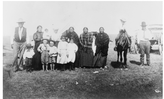
Abb. 7: In Oklahoma lebende Kickapoo nach 1909.