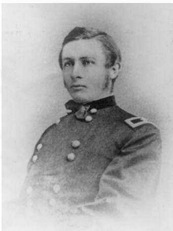
Abb. 1: Col. Ranald S. Mackenzie hatte sich im Bürgerkrieg als tapferer Offizier bewährt und war später Kommandeur des 4. Kavallerieregiments.

Colonel Ranald S. Mackenzie hatte mit seinem 4. US-Kavallerieregiment den ganzen Sommer 1872 gegen die Comanche im westlichen Texas gekämpft und dabei wichtige Erfahrungen im Umgang mit den flexiblen und geschickten indianischen Gegnern gesammelt. Es konnte nur noch eine Frage kurzer Frist sein, würde man die Comanche für immer aus Texas und in eine Reservation ins Indian Territory, das heutige Oklahoma, vertrieben haben. Die Feldzüge des Jahres 1872 hatten die Truppe jedoch erschöpft und der Nachschub im dünn besiedelten Land mit seinen schlechten Verkehrsverbindungen war nicht im erforderlichen Maße aufrecht zu erhalten, um den Kampf sofort fortsetzen zu können. Das Regiment zählte no-