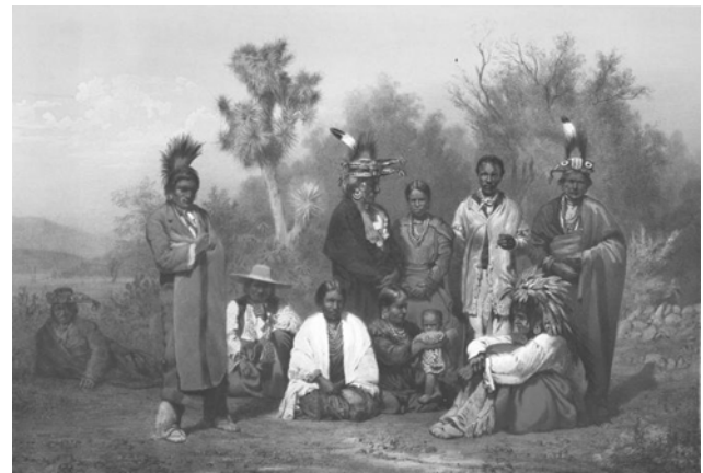
Abb. 3: Gruppe mexikanischer Kickapoo, die 1865 Kaiser Maximilian von Mexiko besuchten.

Die Seminole waren dort aber gelegentlichen Repressalien durch die zahlenmäßig stärkeren Creek ausgesetzt, die unter den Seminole flüchtige schwarze Sklaven suchten oder gelegentlich Menschen raubten. (Unter den Seminole hatten die Schwarzen, mitunter ehemalige Sklaven, häufig den Status freier Menschen inne.) Obwohl Creek und Seminole im eigenen Bewusstsein verschiedene Stämme repräsentierten, wurden sie von den USA noch über viele Jahre als ein Stamm angesehen und mussten sich eine Reservation teilen. Es war der aus dem Seminolenkrieg bekannte Häuptling Wild Cat, ein Kampfgefährte Osceolas, der gegen 1850 eine Anzahl Seminole nach Mexiko führte und sich dort in angemessener Entfernung der Kickapoo niederließ.