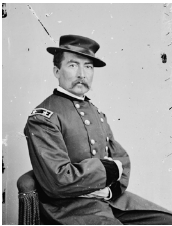
Abb. 4: General Phillip H. Sheridan kommandierte in den 1870er Jahren die Military Division of the Missouri, wozu praktisch der gesamte "indianische" Westen gehörte.

Da das auf einem Hügel gelegene Ft. Clark noch von der 9. Kavallerie belegt war, richteten sich die Neuankömmlinge in einem unterhalb gelegenen Eichenwäldchen ein Feldlager her.